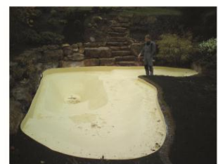
Teich Heilbad Heiligenstadt 2009