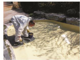
Versiegelung der Oberfläche